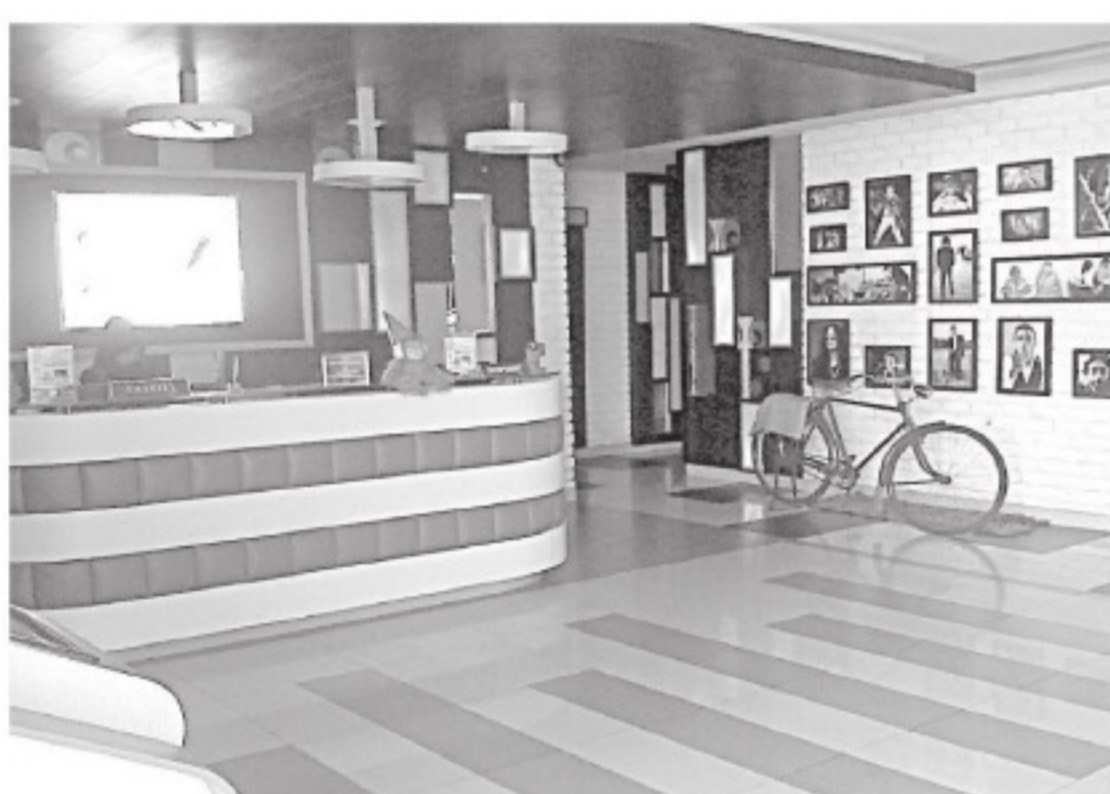
STUDIO Family Karaoke, Kompleks Riau Bisnis Centre (RBC) berkonsep musik klasik dengan interior unik penuh bingkai inspirasi musik dipadu warna hitam putih. (iko)

Selain itu, lanjutnya, bagi yang melakukan transaksi 150 ribu mendapatkan kupon undian memperebutkan ber-