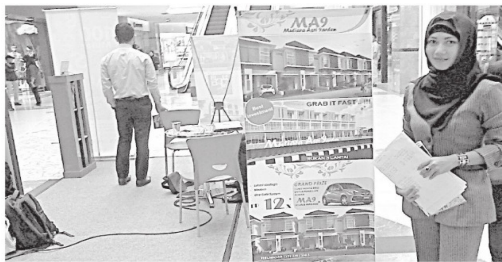
HUNIAN Mutiara Asri Garden Jalan Arifin Achmad menggelar pameran di Mal SKA dari tanggal 11-15 Maret. (iko)

PEKANBARU - Berbagai program ditawarkan pelaku perumahan di Pekanbaru, mulai dari cashback, uang muka ringan serta hadiah lainnya. Hal ini bertujuan untuk mempromosikan huniannya.