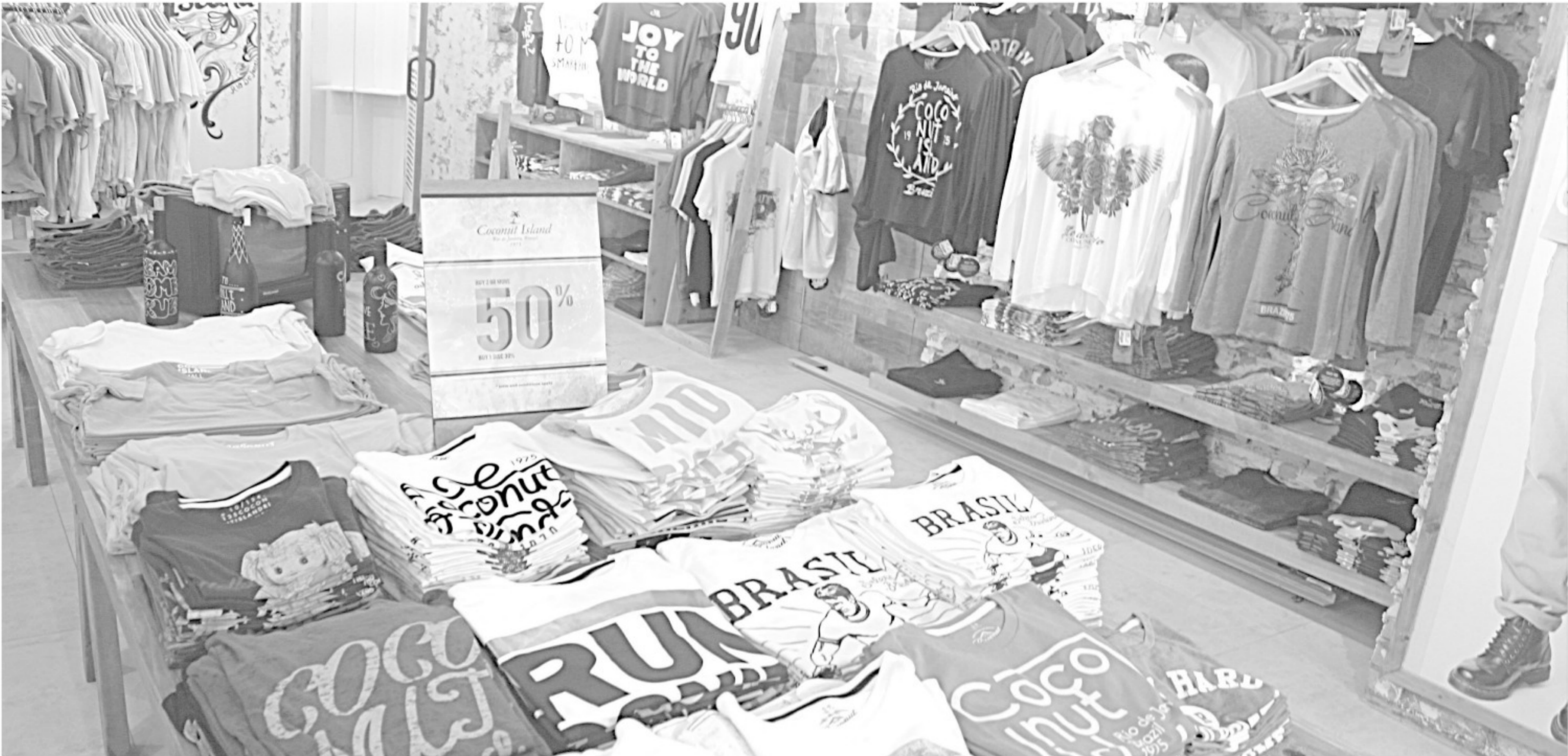
PROMO hanya berlaku selama dua hari, mulai 14 hingga 15 Maret.