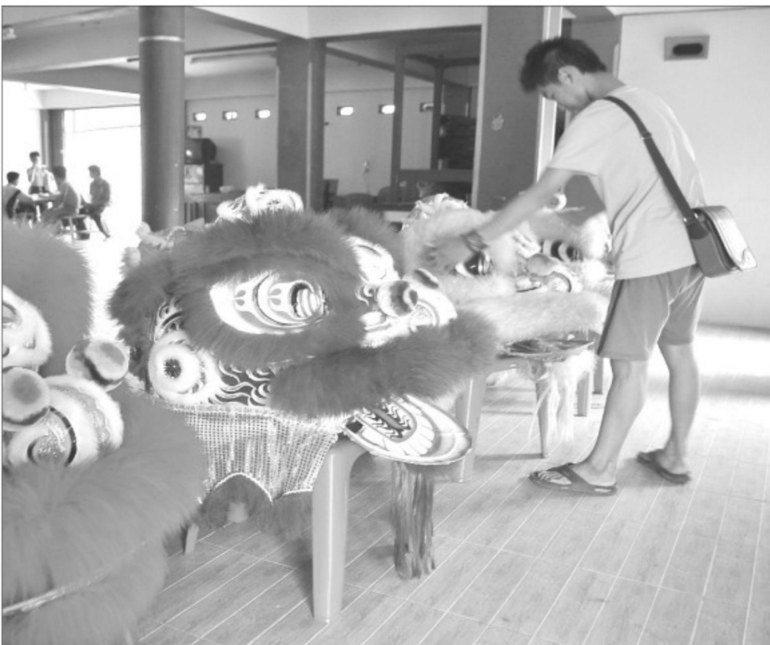
BARONGSAI - Seorang pekerja merapikan topeng barongsai di Vihara Surya Dharma, Jalan Angsaka, Kecamatan Payung Sekaki, Pekanbaru, Jumat (13/3). Atraksi barongsai atau tarian liong ini dipercaya warga Tionghoa membawa keberuntungan. (yudi)

Kendala lainnnya, ka-ta Dedi, hingga saat ini Rancangan Tata Ruang Wilayah ( RTRW) Peka-nbaru juga belum ada ke-jelasan. Sedangkan un-tuk infrastruktur, lan-jut Dedi, pemko sedang menggenjot pengerjaan-nya melalui proyek multi-years . “Kawasan Industri Tenayan (KIT) itu belum jelas RTRW-nya. Kalau infrastruktur sedang dike-but,” imbuhnya. (del)