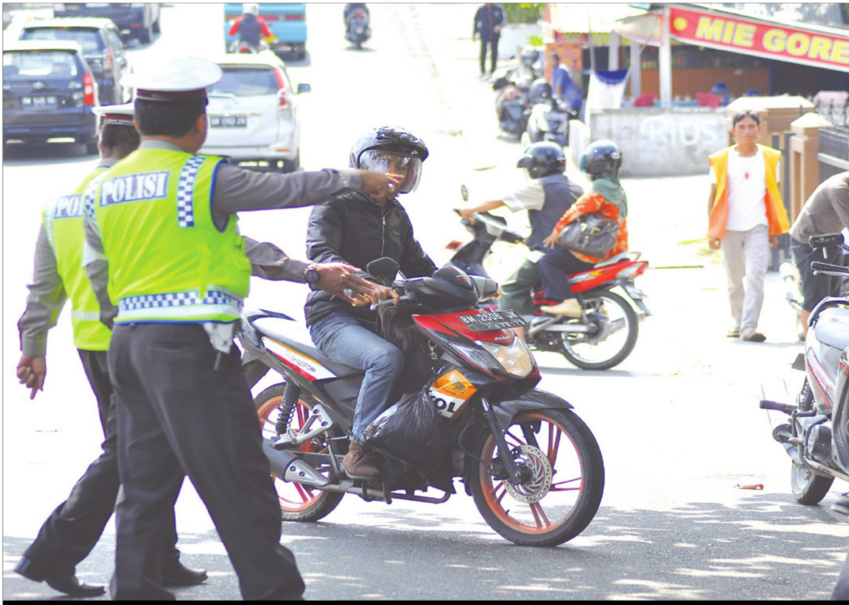
警方为提高驾驶人的交通安全意识，日前在大街上拦检，取缔交通违规的驾驶人。