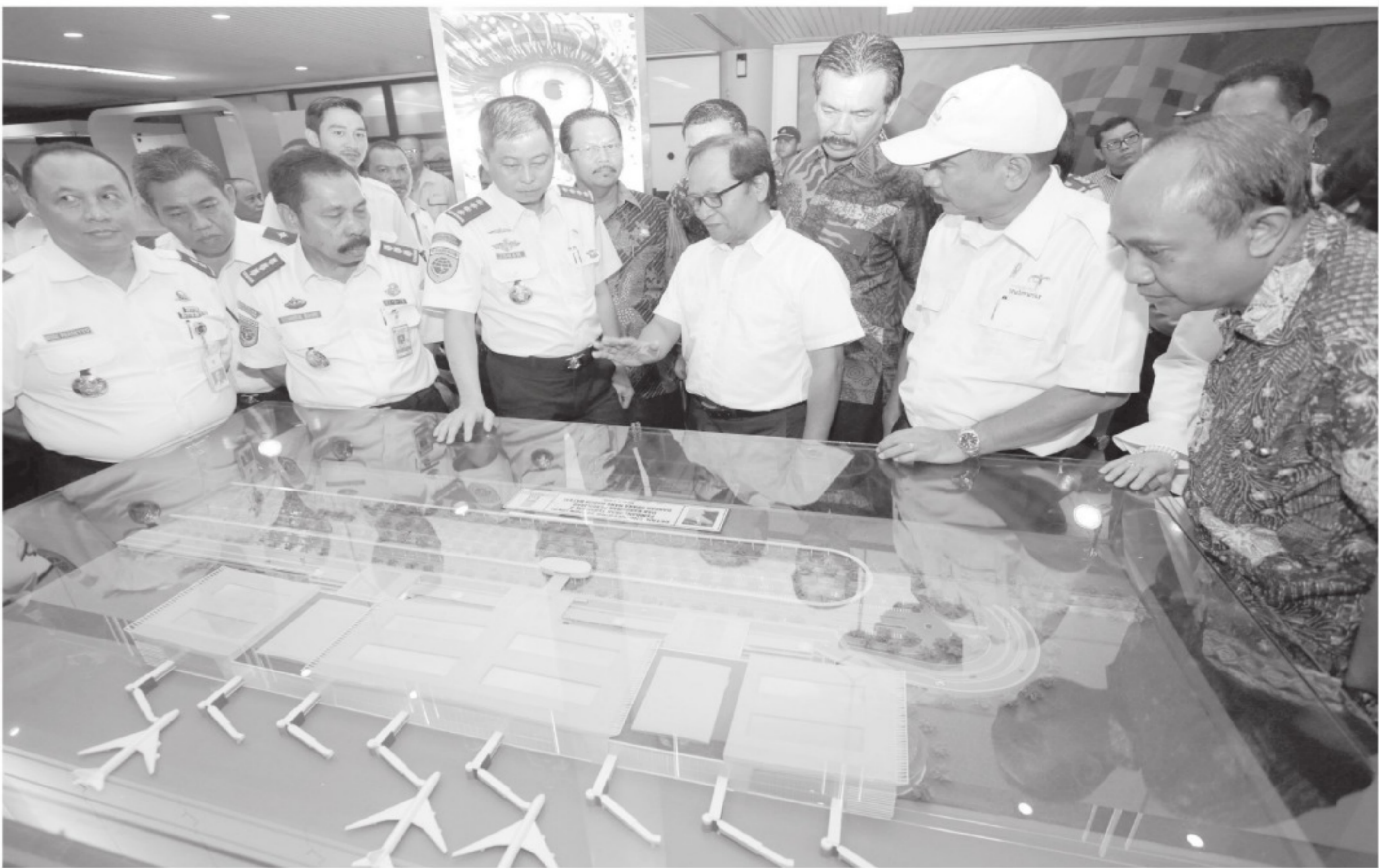
TINJAUAN - Menteri Perhubungan, Ignasius Jonan (keempat kanan) dan Menteri Pariwisata, Arief Yahya (kedua kanan) meninjau fasilitas dan sarana prasarana Bandara Internasional Hang Nadim, Batam, Kepulauan Riau, Jumat (13/3). Peninjauan tersebut dilakukan untuk meningkatkan pelayanan kepada para pengguna jasa angkutan udara dan wisatawan lokal maupun asing yang keluar masuk Batam melalui bandara tersebut.

ini akan dilakukan perluasan apron agar mampu menampung semakin meningkatnya penerbangan,” jelasnya. Apron, kata Mustofa, akan diperluas 150x240 meter pada sisi kiri sekitar terminal kargo yang akan mampu menampung tambahan empat pesawat berbadan lebar. Saat ini, bandara tersebut memiliki landasan pacu sepanjang 4.025 meter yang menjadikan bandara ini sebagai pemilik landasan pacu terpanjang di Indonesia. Dengan kondisinya saat ini, Bandara Hang Nadim dapat menampung 18 pesawat berbadan lebar dengan jenis Boeing 767. Bandara tersebut juga sudah ditetapkan sebagai penghubung (hub) domestik Lion Air yang selanjutnya pada 2015 juga akan dilakukan penghubung internasional maskapai tersebut. Saat ini, Lion Air menguasai sekitar 35 persen penerbangan dari Hang Nadim, diikuti Citilink 20 persen, Garuda 15 persen, sisanya maskapai Sriwijaya Air, Wings Air, Malindo Air dan Firefly. (int/efi)