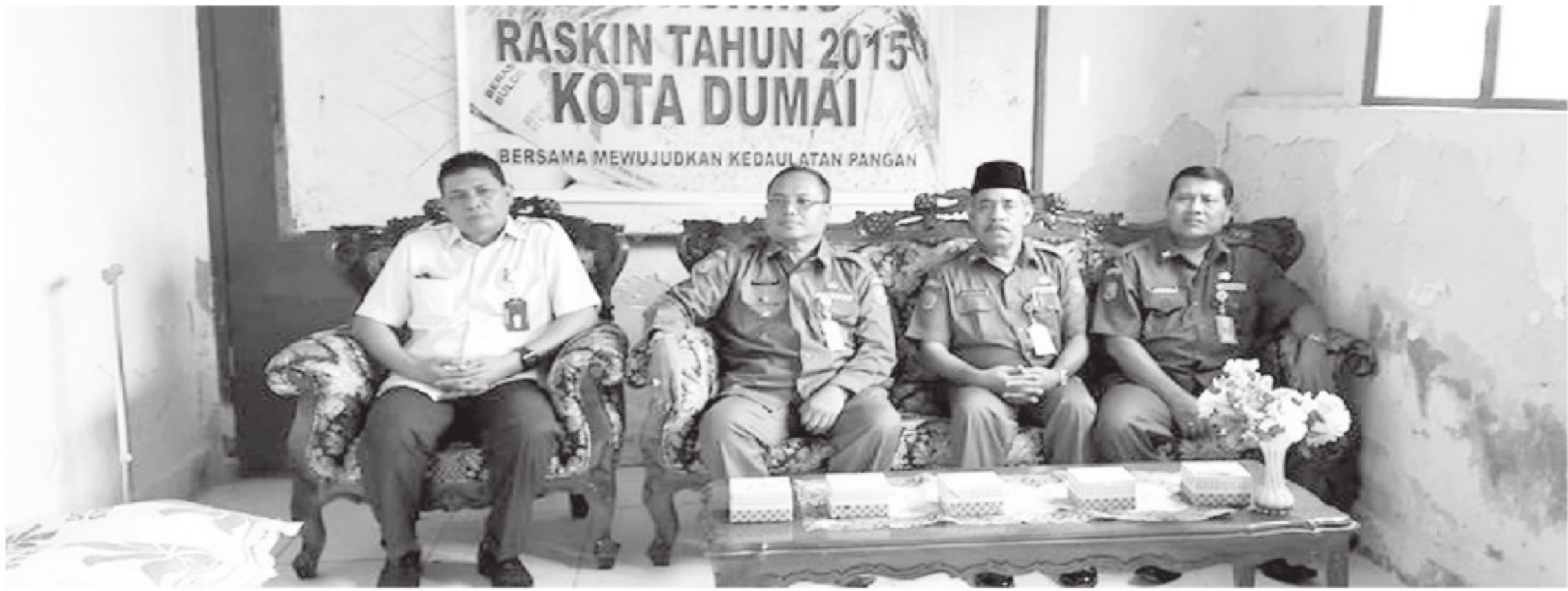
BAGIKAN RASKIN - Walikota Dumai, Khairul Anwar, meresmikan (launching) pembagian raskin (beras miskin) gratis di Kelurahan Laksamana Kecamatan Dumai Barat, baru-baru ini. (bam)

Sementara itu, Walikota Khairul berharap penyaluran raskin di Kota Dumai tepat sasaran dan berjalan sesuai juknis (petunjuk teknis). "Penyaluran raskin harus tepat sasaran sesuai data dan sesuai juknis," tukasnya. *