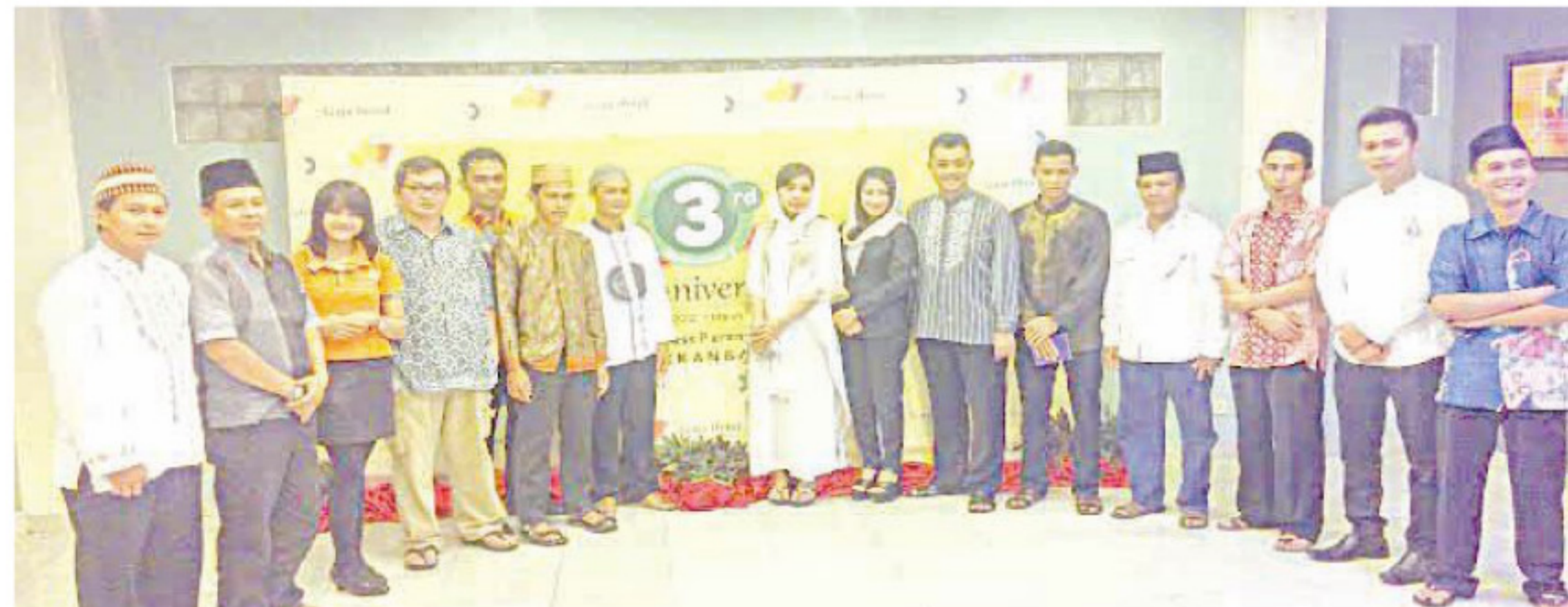
PENGURUS panti asuhan dan jajaran management Discovery Hotel Group, Gaja dan Paramita Pekanbaru foto bersama. (ist)