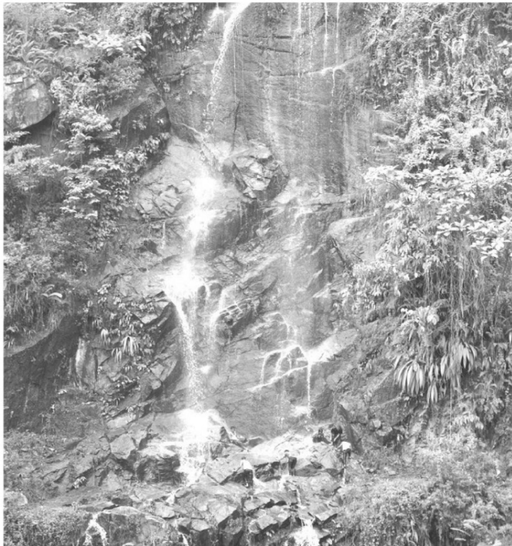
BERMAIN - Beberapa pria bermain di bawah derasnya guyruran air terjun di Desa Alim, Kecamatan Batang Cenaku, Indragiri Hulu. Walau dikelilingi panorama alam yang indah, namun potensi wisata air terjun ini hingga kini belum tergali. (int)