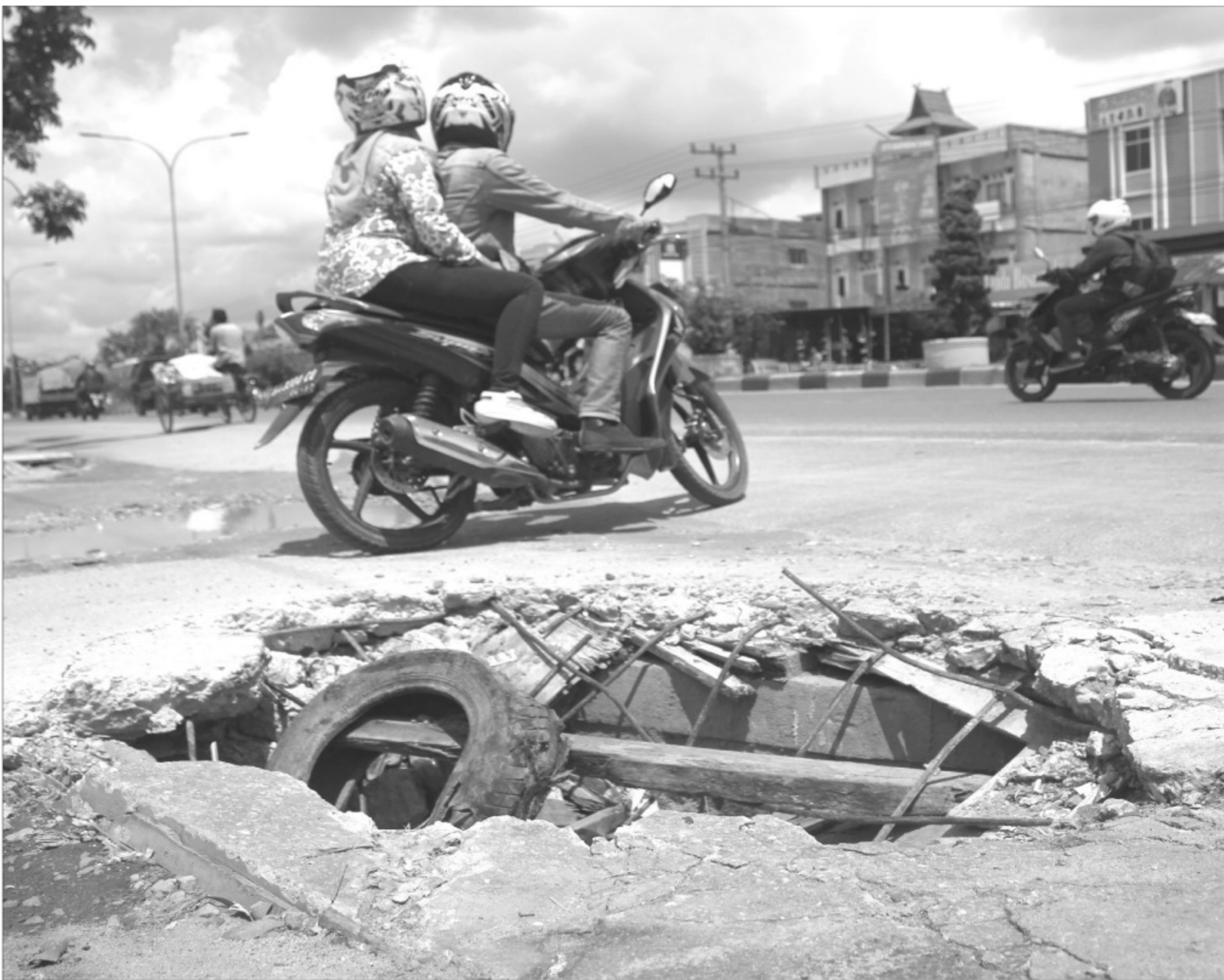
TROTOAR RUSAK - Pengendara melintas di sekitar trotoar rusak di Jalan HR Soebrantas, Panam, Pekanbaru, Jumat (13/3). Kondisi tersebut dapat membahayakan para pengguna jalan, khususnya pada malam hari. (yudi)

dan tidak bergonta ganti. “Kita imbau para keluarga untuk membentengi iman dari hal yang paling kecil,” imbuhnya. *