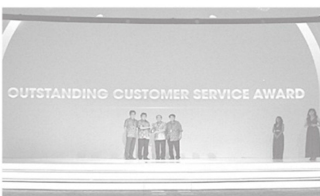
TOYOTA Motor Corporation selaku principal, memberikan penghargaan Customer Service Excellence Award (CSEA) kepada PT Toyota Astra Motor.