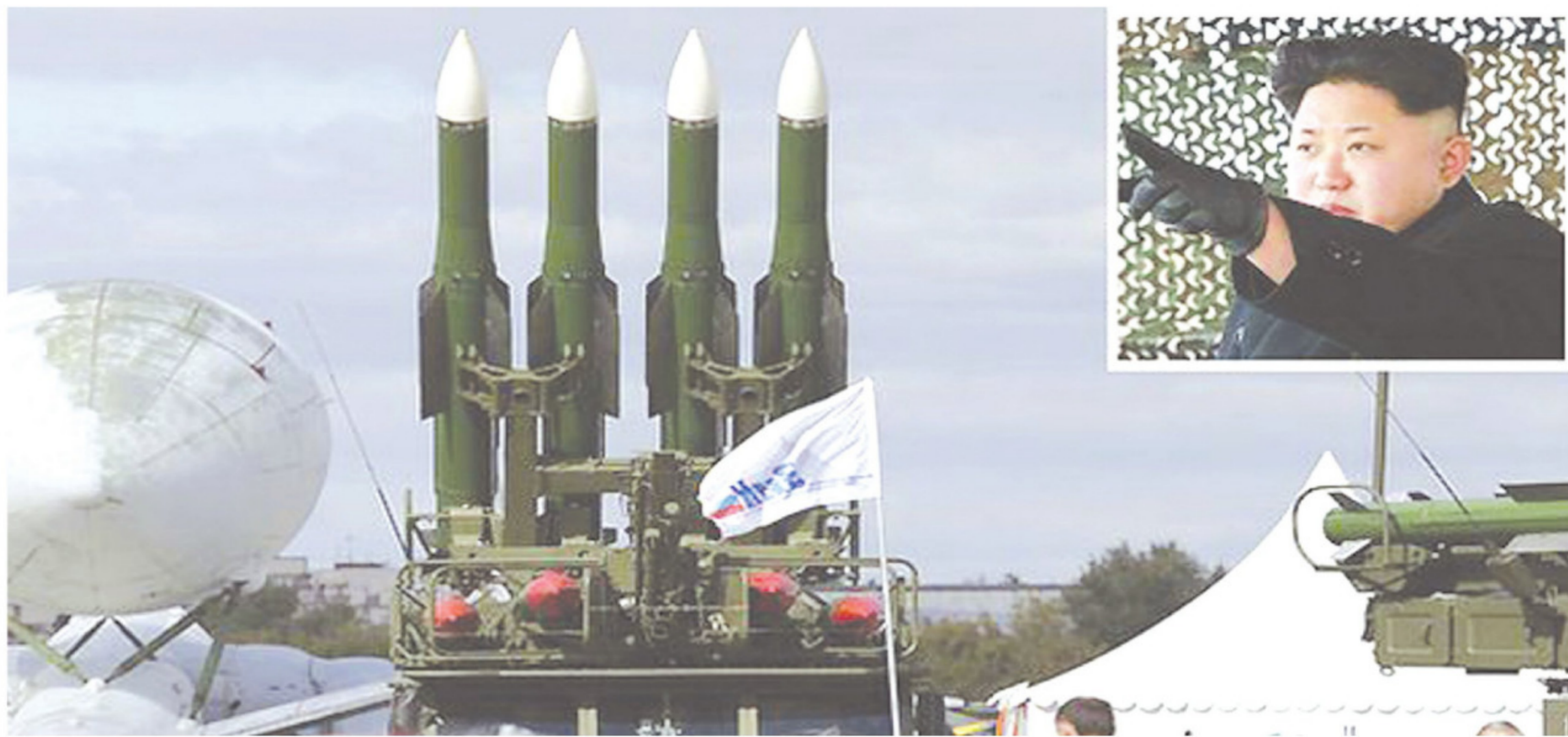
南韓「聯合參謀本部」表示，北韓進行了「地對空飛彈發射訓練」，北韓領袖金正恩，親自觀察了訓練過程。