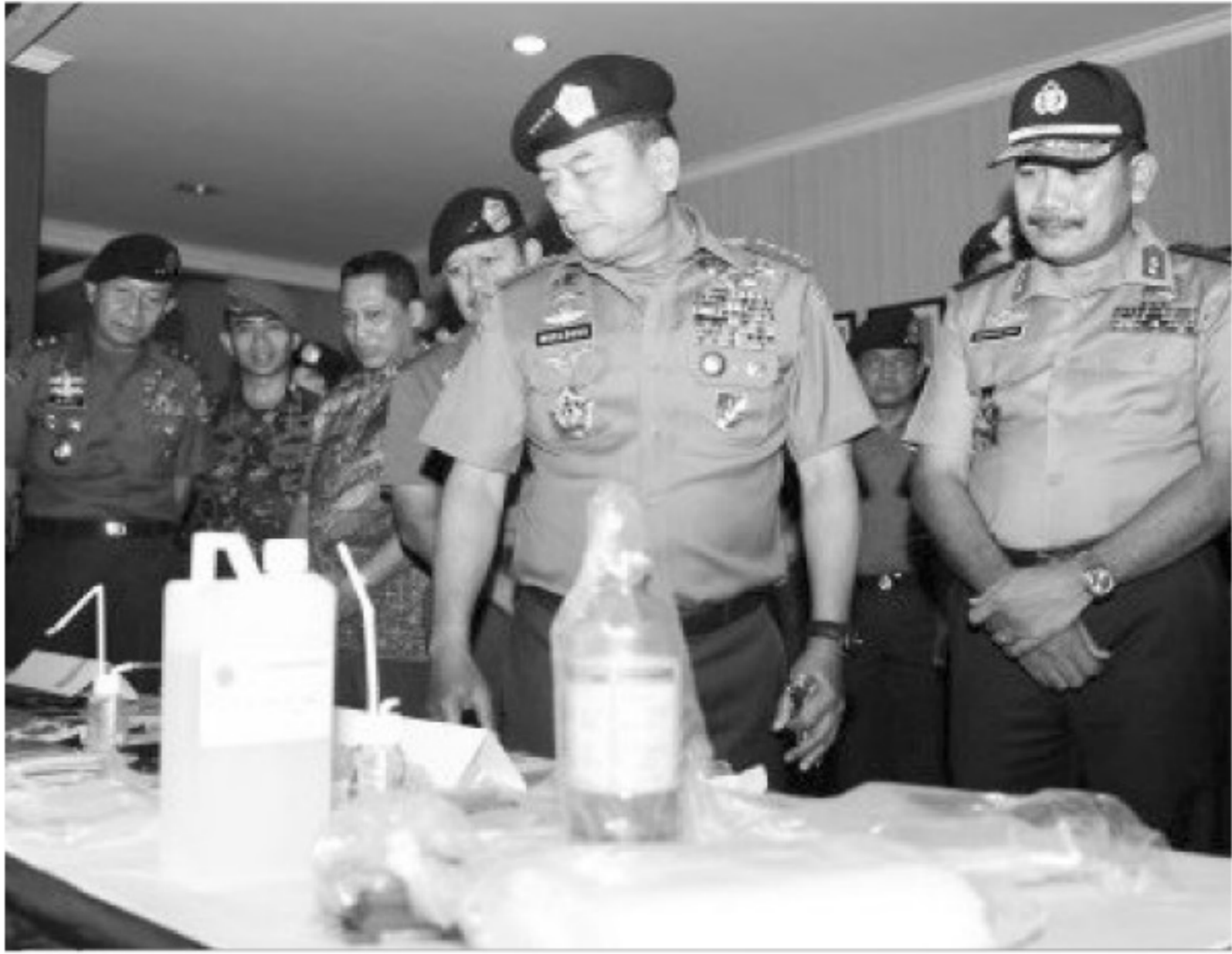
PENGUNGKAPAN KASUS BLACK DOLLAR - Panglima TNI Jenderal TNI Moeldoko (kedua kanan) didampingi Wakapolri Komjen Badrodin Haiti (kanan), Pangarmabar Laksamana Muda TNI Widodo (ketiga kanan) dan Kepala Badan Reserse dan Kriminal Polri Komjen Budi Waseso (keempat kanan) seusai meninjau ribuan barang bukti black dollar dan narkotika di Mako Pusat Polisi Militer TNI AL di Jakarta, Jumat (13/3). TNI menyerahkan barang bukti sebanyak 69.000 lembar uang mentah yang biasa digunakan pada praktek pencucian uang (black dollar), pecahan 100 dollar AS, 5 kotak penyimpanan, 1 unit mesin penghitung merk Z54 2710, sabu serta alat isap dan dua tersangka sipil kepada Polri untuk dilakukan proses hukum lebih lanjut.

Dalam amar putusannya, majelis hakim PN Pekanbaru yang dipimpin Ida Bagus Dwiyantra SH, tanggal 25 September 2012, ketiga terpidana terbukti melanggar pasal 340 juncto pasal 55 KUHP tentang Pembunuhan Berencana yang Dilakukan Secara Bersama-sama. (lda)