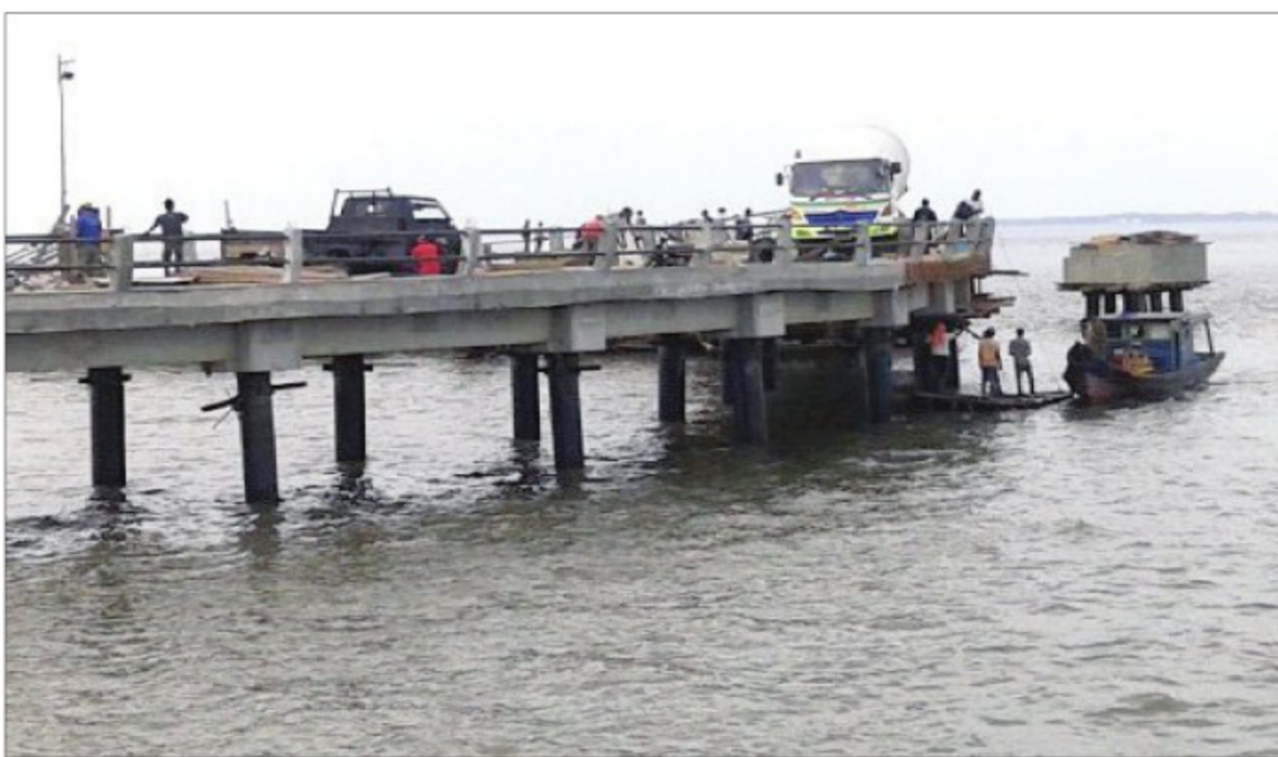
DERMAGA - PT Nindya Karya, rekanan pelaksana pembangunan Dermaga Roro Sungai Selari, Kecamatan Bukit Batu, masih bekerja, meski masa penambahan waktu telah berakhir tanggal 20 Februari 2015 lalu. (zul)

"Kalau mereka masih ngotot bekerja silahkan saja. Na-