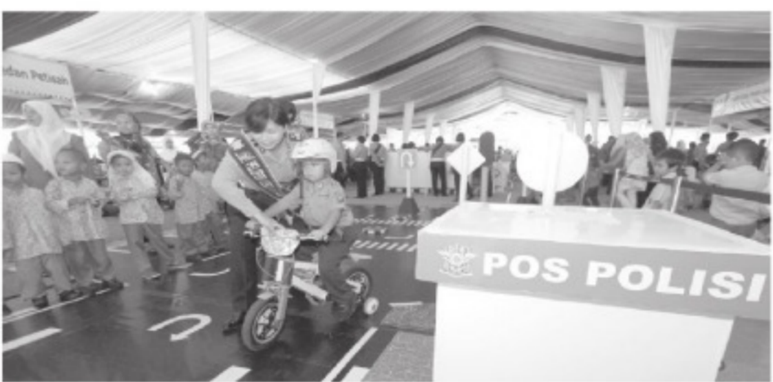
PENDIDIKAN LALU LINTAS - Seorang polwan memberikan pendidikan tentang berlalu lintas kepada siswa Taman Kanak-kanak saat pembukaan Taman Lalu Lintas Portable di Medan, Sumatera Utara, Jumat (13/3). Pendidikan tersebut diberikan agar siswa dapat memahami dan mengerti tentang peraturan maupun rambu lalu lintas sejak dini.

Sumatera Barat (Sumbang) akan mengoperasikan Pembangkit