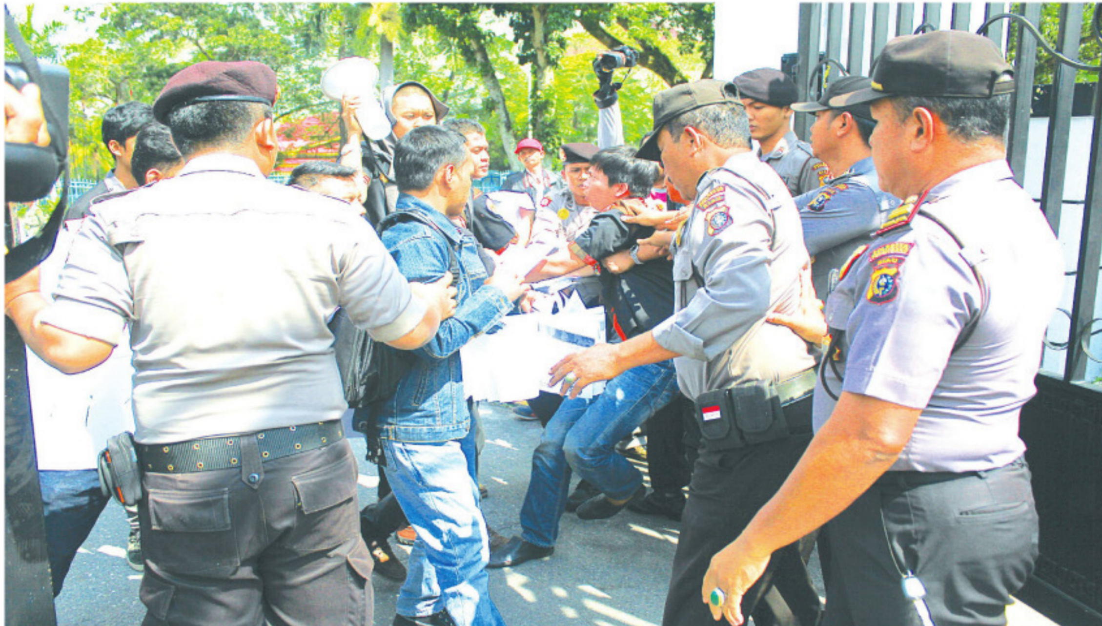
UNJUK RASA - Belasan massa dari Satuan Pelajar Mahasiswa Pemuda Pancasila (Satma PP) Riau menggelar unjuk rasa di depan Kantor DPRD Provinsi Riau, Pekanbaru, Jumat (13/3). Mereka meminta DPRD Riau segera menertibkan perusahaan-perusahaan yang tidak berkontributor bagi kesejahteraan daerah dan masyarakat Riau.