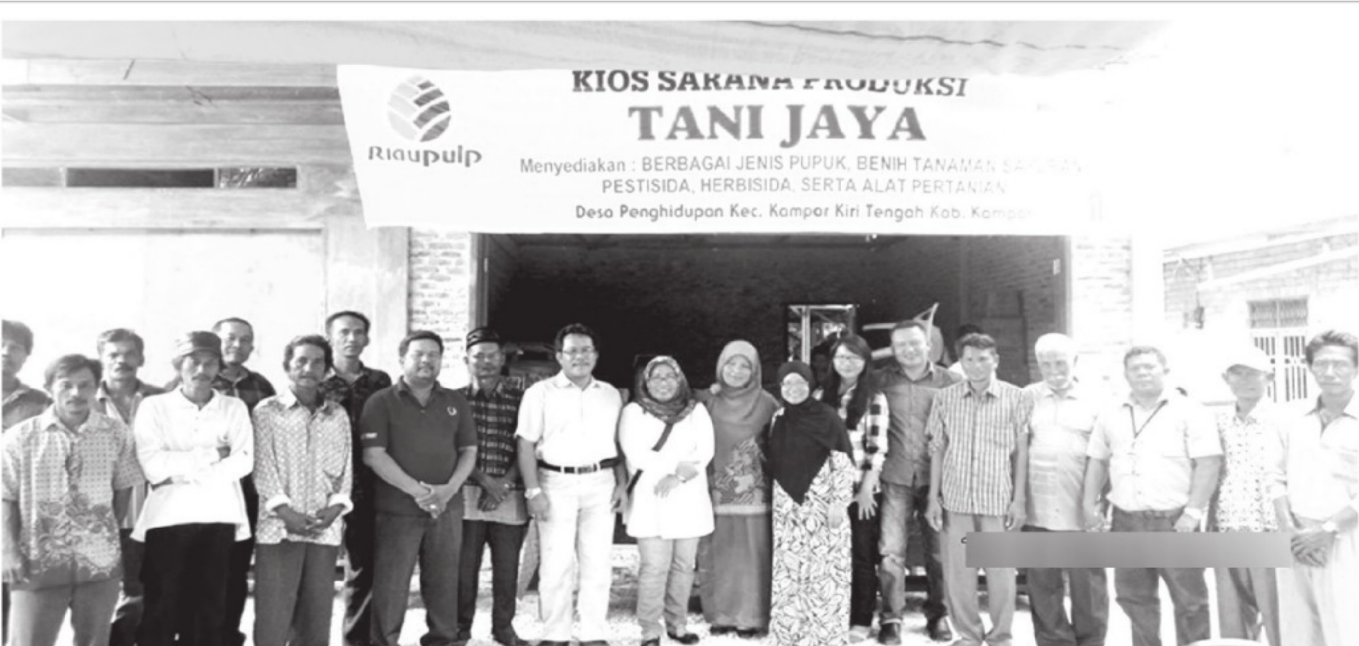
FOTO BERSAMA - Kebersamaan Tim Community Development (CD) PT RAPP dengan anggota Kelompok Tani binaan saat peresmian Kios Sarana Produksi Tani Jaya di Desa Penghidupan, Kecamatan Kampar Kiri Tengah, Kabupaten Kampar, baru-baru ini. (ris)

dokumen dan saksi-saksi. Di-ketahui, terdapat nama-nama fiktif dalam pendirian koperasi. Karena itu penyidik juga men-gerat pelaku dengan pasal 263 KUHP," pungk Guntur. *