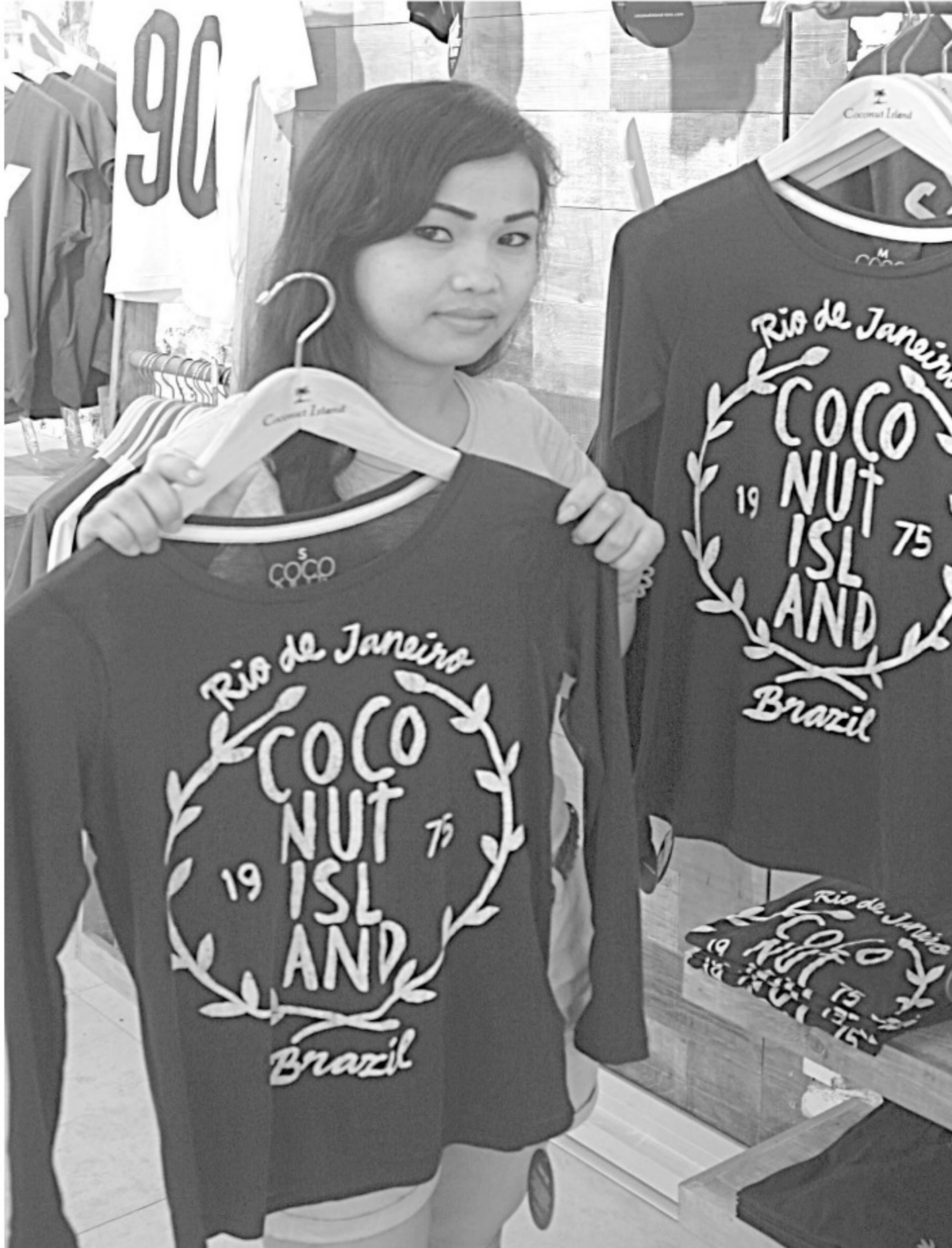
KARYAWAN Coconut Island memperlihatkan salah satu kaos andalan. (mg4)

Rawat dengan baik. Saat panas begini, umumnya kita ingin pakai kaos terus sepanjang musim kemarau. Akibatnya kaos jadi terlalu sering dipakai, yang bisa menyebabkannya berubah. gunakanlah busana santai yang mudah menyerap keringat, seperti baju santai yang berbahan katun, polo t-shirt. Gunakanlah celana pendek dan pakaian dalam yang mudah menyerap keringat juga. (int/wsl)