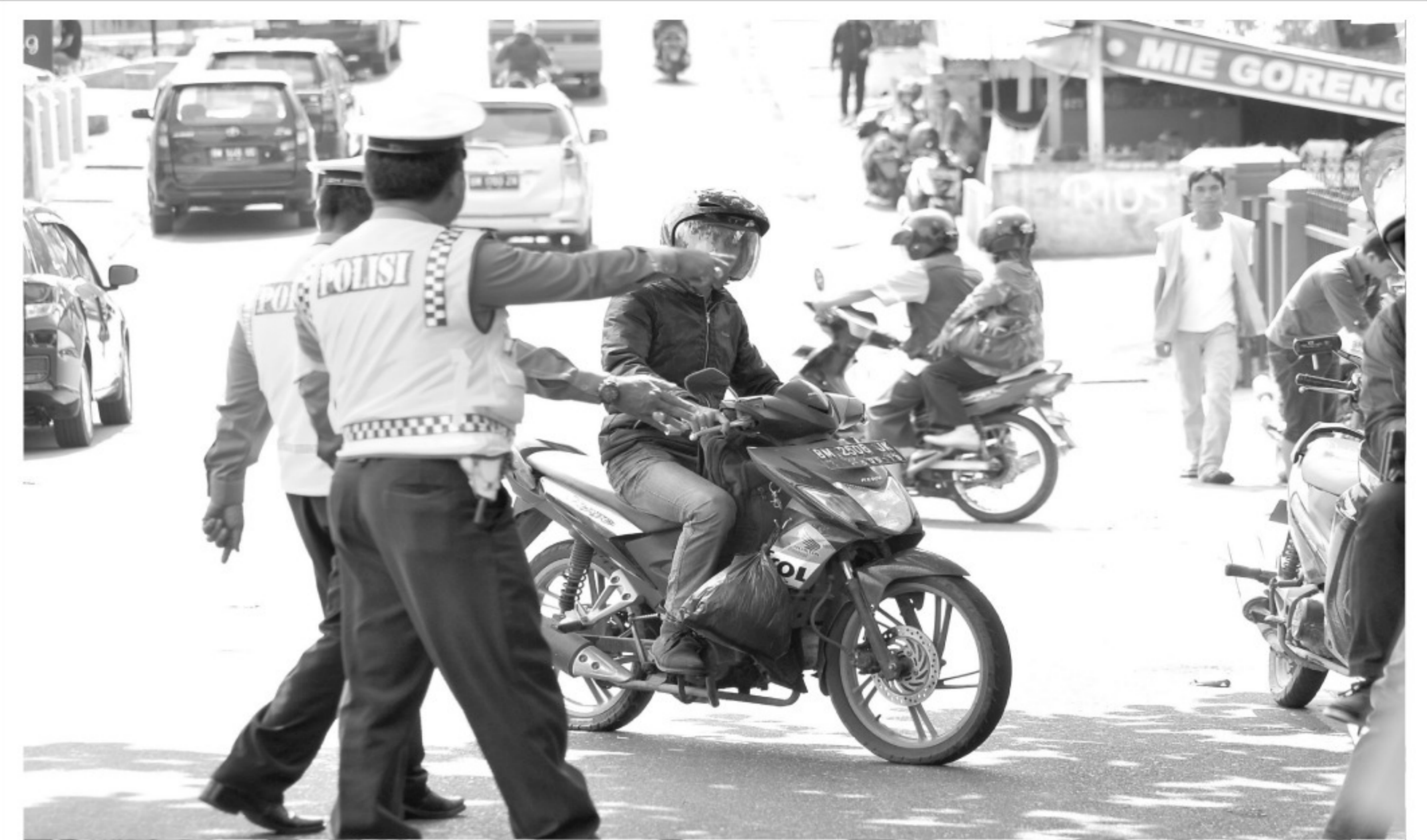
RAZIA LALU LINTAS - Petugas Satuan Polisi Lalu Lintas (Satlantas) memeriksa identitas pengendara dan surat kendaraan bermotor saat razia di di Jalan Pattimura, Pekanbaru, Jumat (13/3). Razia secara tematik sepanjang 2015 ini bertujuan menertibkan pengendara bermotor agar taat dalam berlalu lintas. (yud)

Kasus korupsi yang terbesar di kabupaten Bengkalis itu saat ini terus didalami oleh pihak Kejaksaan. “Saya berharap kepada pihak Bank untuk bisa bekerja sama dan saling membantu soal kasus korupsi ini,” katanya. (mr/Ida)