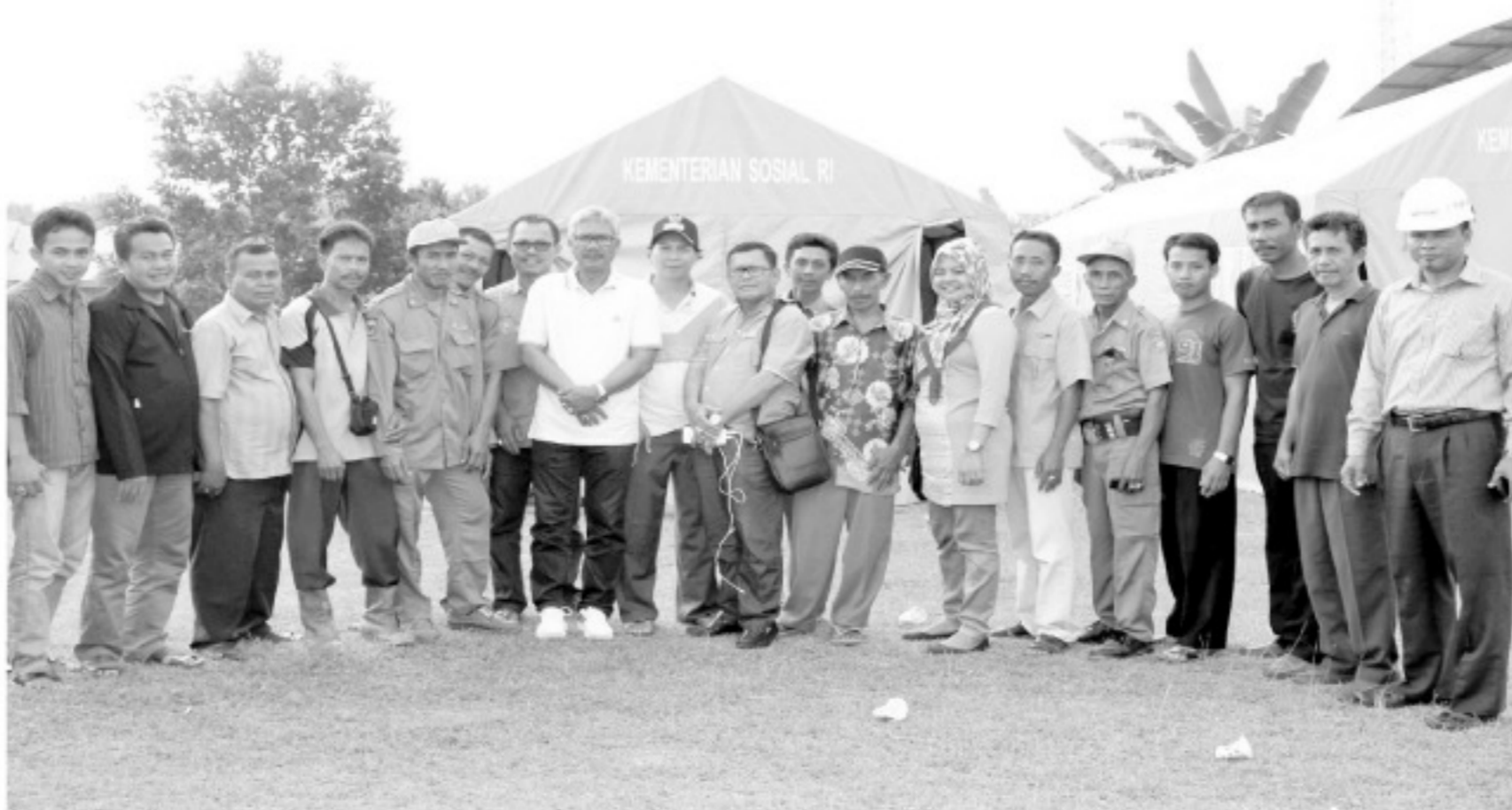
FOTO BERSAMA - Bupati Kuansing, H Sukarmis, foto bersama warga desa disela-sela touring menjemput aspirasi di Kecamatan Singingi, baru-baru ini.

Ia juga meminta pembangunan jembatan Sungai Tabalai yang menghubungkan desa Mudik Ulo dan Serosa yang rusak beberapa waktu lalu. (mr/nel)