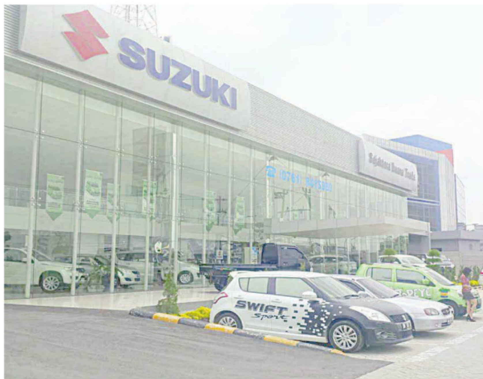
SUZUKI memberi apresiasi kepada konsumen lewat acara bertema 'Semarak Suzuki Pick-up 2015'. (mg4)

Selain itu, sambungnya, konsumen disuguhkan dengan program paket hemat. Dimana konsumen dapat mengikuti general check up Rp250 ribu, ganti oli mesin dan filter oli. Terdapat juga potongan harga untuk suku cadang 10 persen dan gratis cuci mobil dan vacuum," pungkasnya. (mg4)