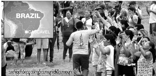
သတ်ဖြတ်ခံရသူ အကျဉ်းသားများ၏ မိသားစုများ