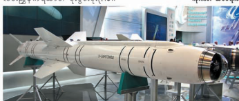
SVP-24 ခုံးကျည်